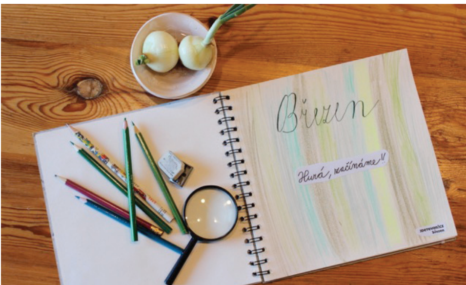
Ukázky Deníku do Divočiny