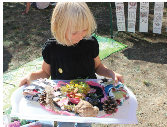
JDĚTE VEN mezi dětmi - akce léto 2015