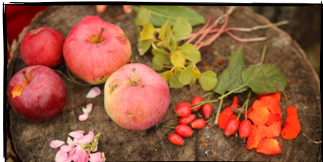
13. Uspořádáme podzimní hostinu