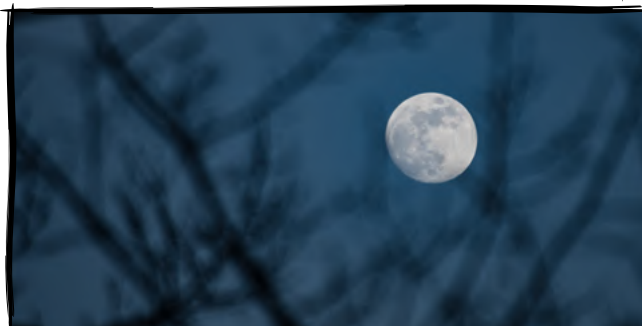
16. Pozorujeme měsíc