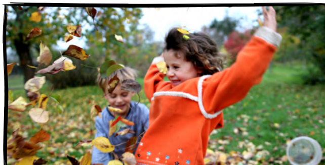
14. Zařadíme si v listí