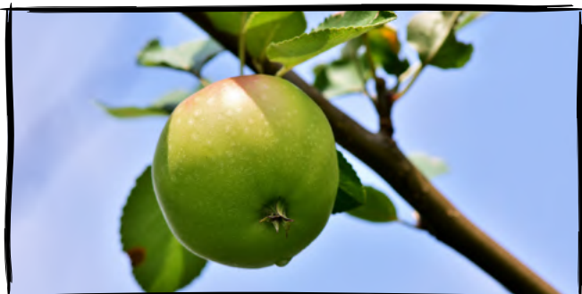
1. Ochutnáme jablko z divoce rostoucí jabloně