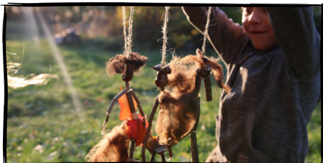
5. Vytvoříme si bezové loutky