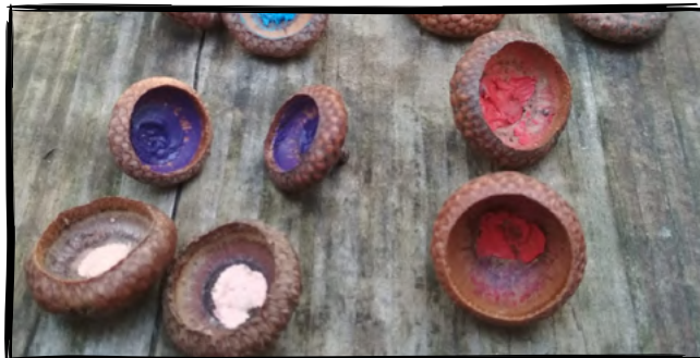
12. Zahrajeme si žaludové pexeso nebo piškvorky