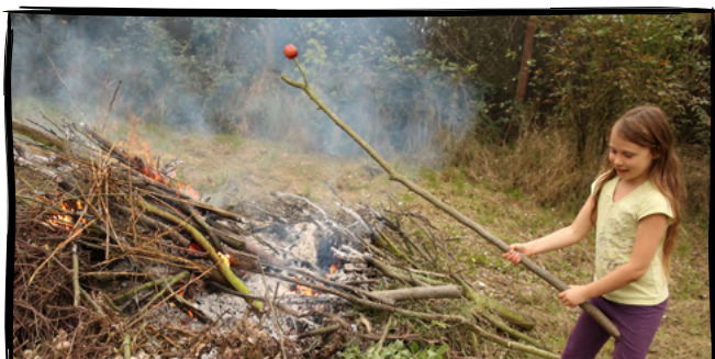
19. Upečeme si brambory nebo jablka na ohni