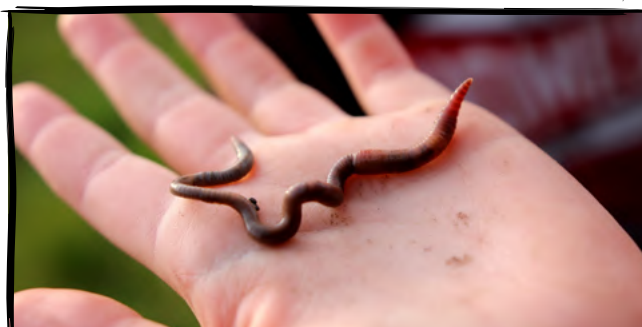
18. Prozkoumáme život v půdě a tlejícím listí