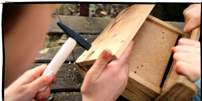
15. Vyrobité krmítko pro ptáky