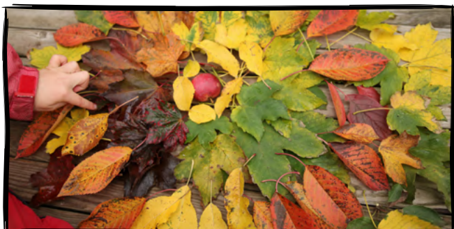
9. Nasbíráme podzimní barvy