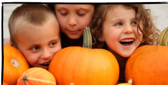
20. Vymyslíme si vlastní podzimní výzvu