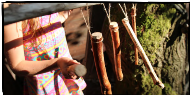
3. Uspořádáme venkovní koncert