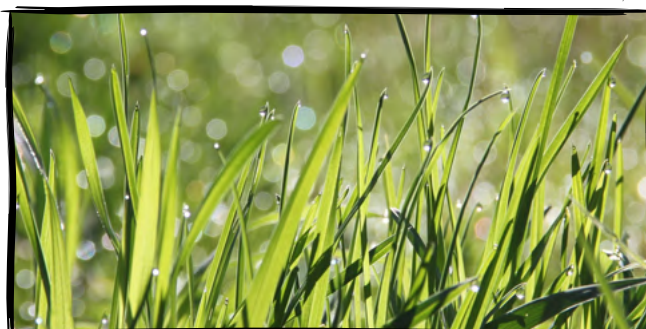
8. Proběhneme se ranní rosou