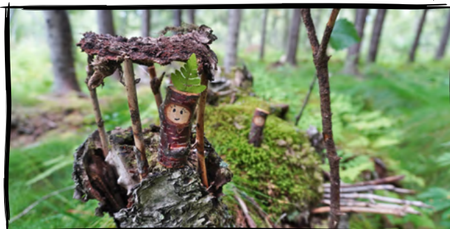
6. Postavíme skřítkům domeček na přání