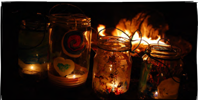
7. Vytvoříme si lampión