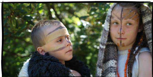
11. Vyrobité si válečnické malování