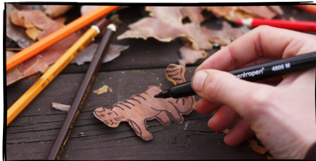
2. Vytvoříme obrázky z kůry