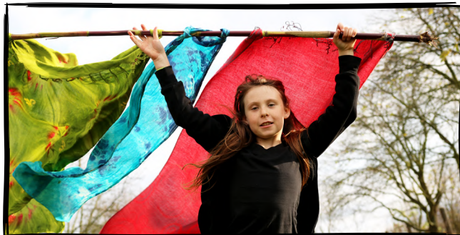
2. Uspořádáme závod s větrem