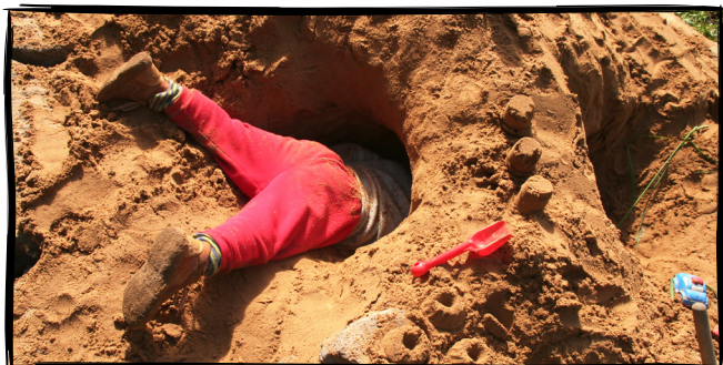
9. Postavíme venkovní hrad, bunkr nebo hnízd