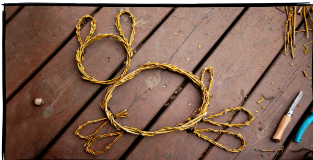
10. Vytvoříme si proutěného zajíčka