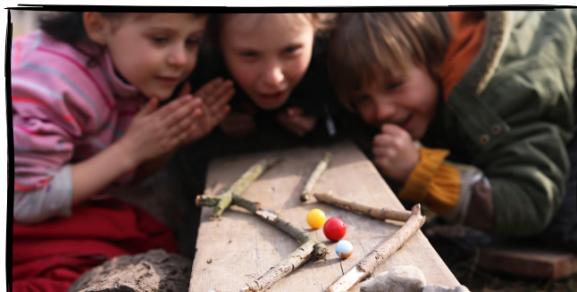
14. Zahrajeme si kuličky a postavíme kuličkodráhu