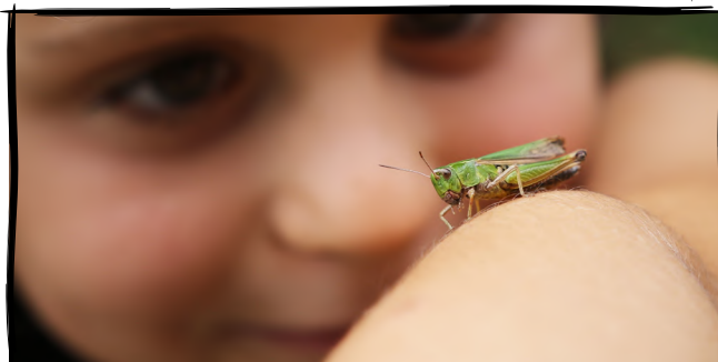
16. Sledujeme dobrodružný život v trávě