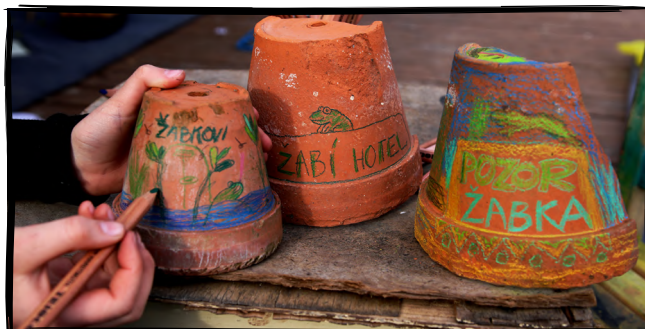
4. Postavíme domek pro žabky