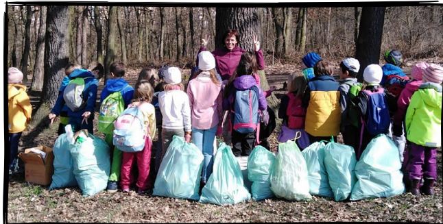
12. Uklidíme venku (přidáme se k Uklid'me Česko )