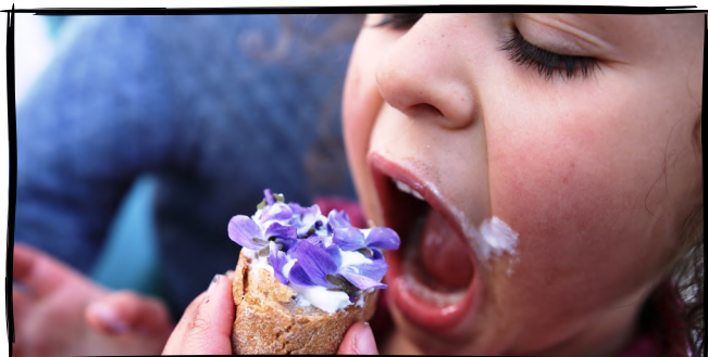
1. Posváčíme jarní vitamíny