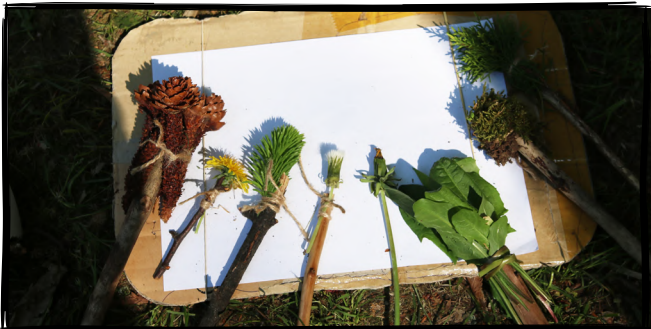
7. Vytvoříme si přírodní štětky