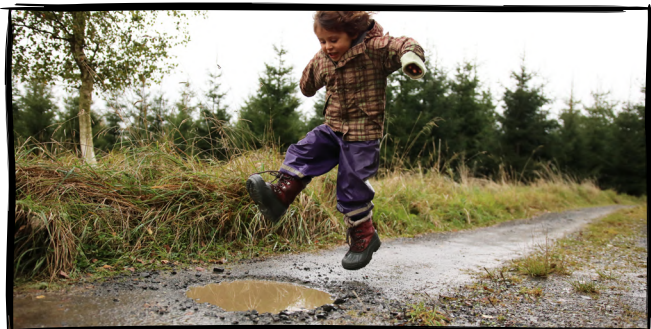
5. Zmokneme s úsměvem nebo skočíme do kaluže