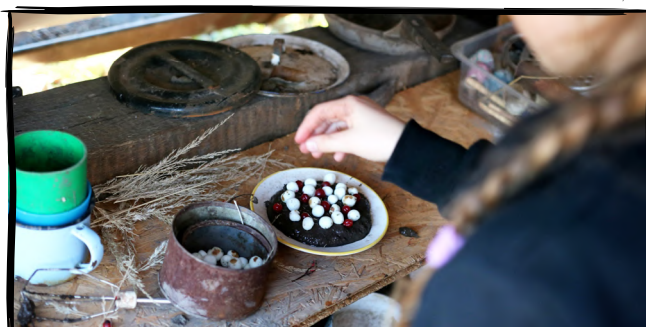
18. Otevřeme sezónu blátivé kuchyně