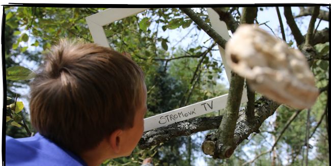
19. Vyrobitíme si stromovou televizi