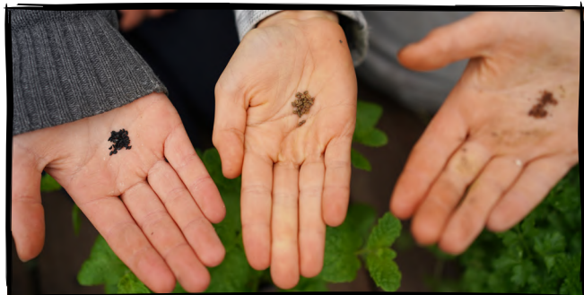
3. Zasadíme semínka či sazeničky