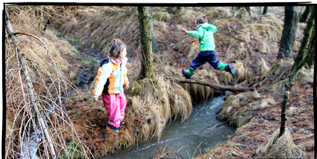
17. Prozkoumáme břehy potoka , než zarostou