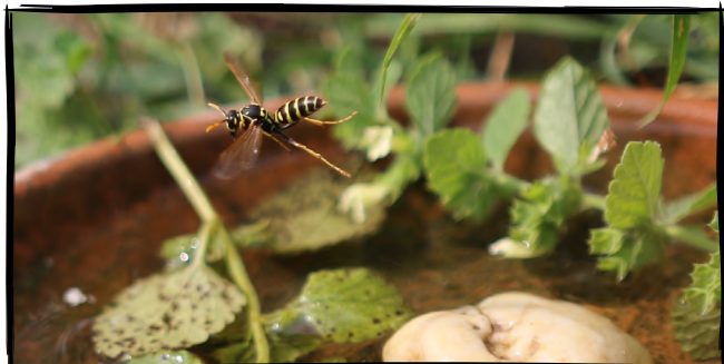
13. Vyrobitíme a sledujeme pítko pro hmyzáky