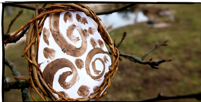
8. Namalujeme obrázek blátem