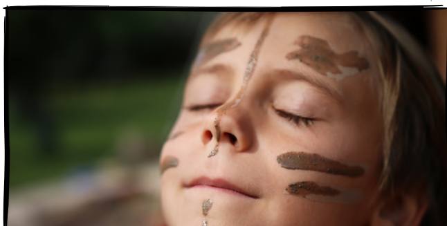
20. Plánujeme naše další výzvy ven...