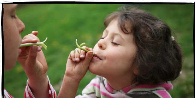
15. Vyrobitíme si frkačku a hodinky z pampelišky