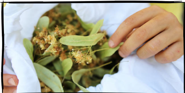
11. Nasušíme si bylinky na čaj